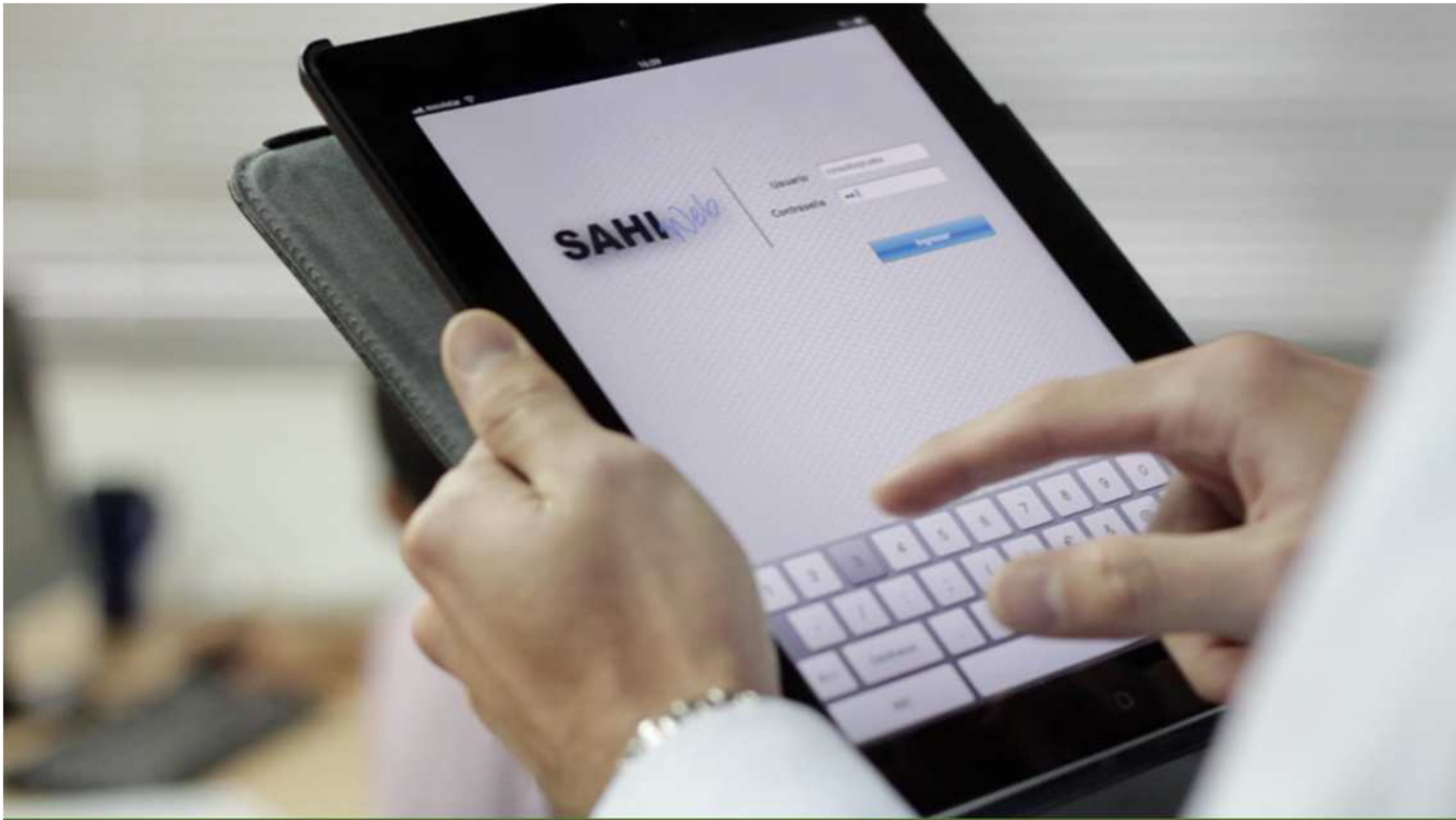
Proyecto 346: 5ta Versión del Software SAHIWeb para Telemedicina en dispositivos móviles.